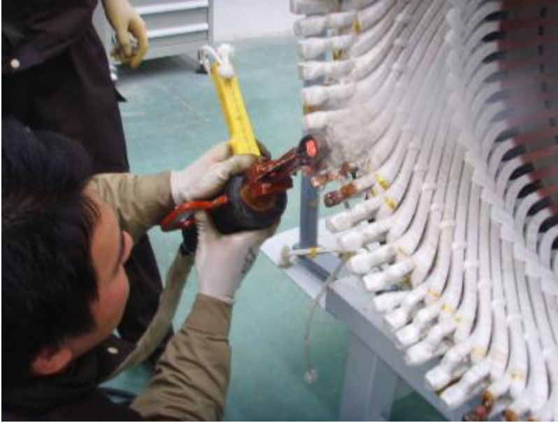
手持变压器焊接连线焊