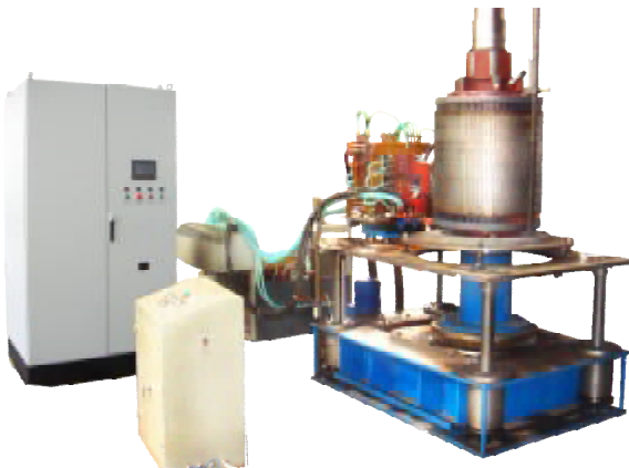
电机转子感应焊成套设备