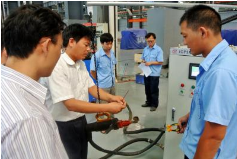
手持焊机现场照片