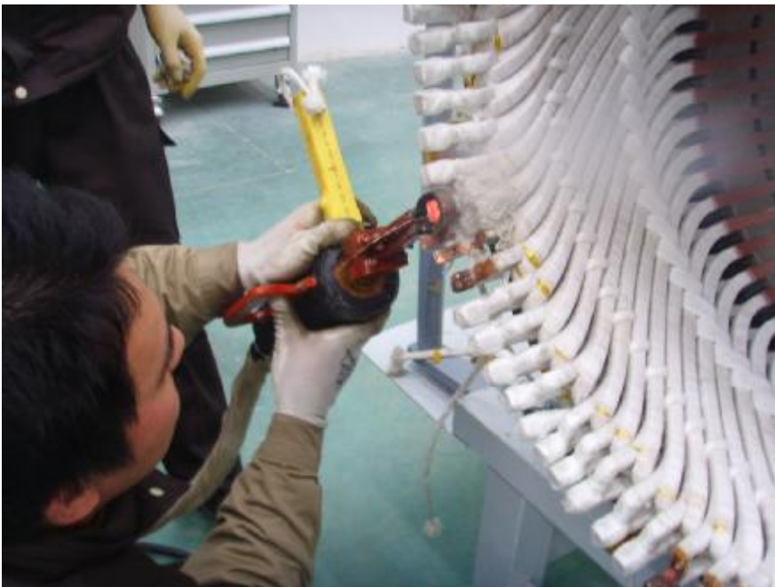
手持变压器焊接定子接头